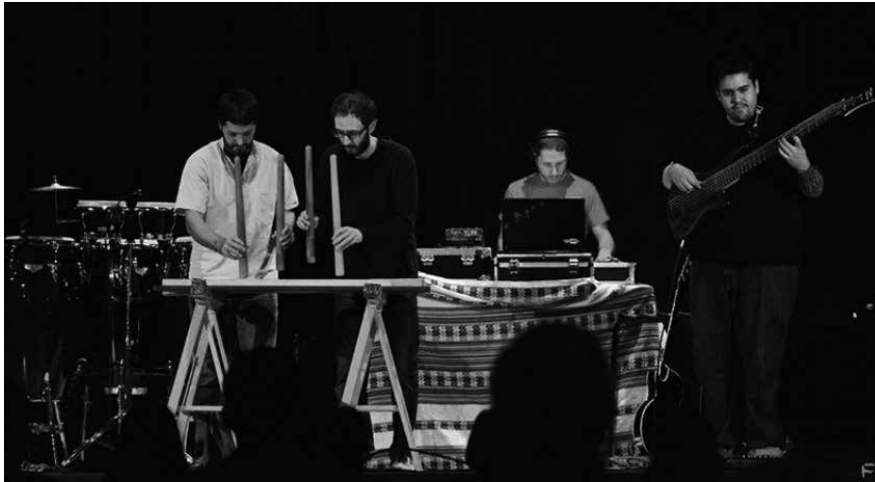
"Munduko Beat" Museo de América (Madrid'15).

El espectáculo de Munduko Beat se desarrolla de manera ininterrumpida; elaboradas bases electrónicas, loops grabados en directo, técnicas de scratch en vinilo, completo set de percusión cubana, txalaparta, groove a cargo del bajo y la guitarra y melodías embaucadoras de las flautas traveseras son los elementos utilizados para embarcar al público en un viaje de infinitos ritmos y colores y captar su atención desde el principio del espectáculo hasta el final.